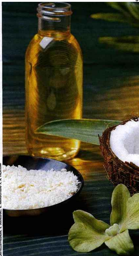
CASTELLOPREDAH; V. SIEGESS; K. ARRASSTUDIO X. A. FALK/JUMP